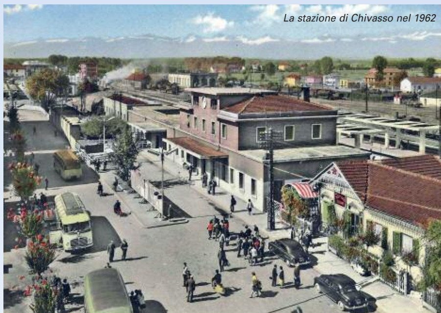
La stazione di Chivasso nel 1962